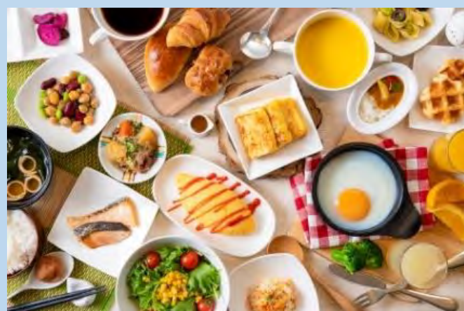
*朝食（和洋食buffet）付きの場合 お一人様あたり¥3,300追加