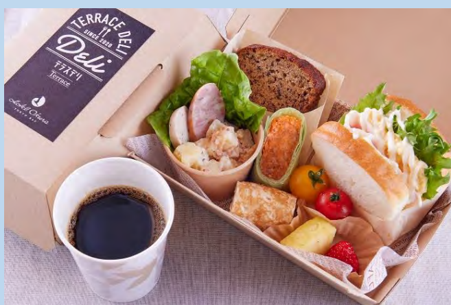
*モーニングBOX付きの場合 お一人様あたり¥2,000追加